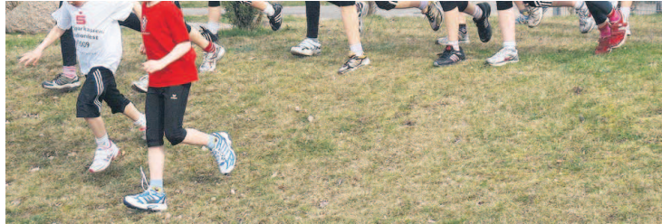
In Marlow testen sich die PSVler für die Langstaffel-Wettbewerbe in Rostock.

C-Junioren (heute, 9.30 Uhr): Loitz-FCN Mitte, Möllenhagen/Bocksee-Woldegk, Tripkendorf-Wredenhagen